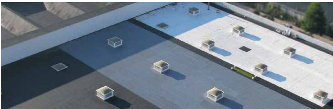
Jaarbeurs Utrecht - Diverse proefdaken

Naast Noxite heeft Icopal binnen dit project ook een dakafwerking met Coolpaint, met warmtereflecterende verf gedemonstreerd. Dit product heeft temperatuurregulerende en isolerende eigenschappen.